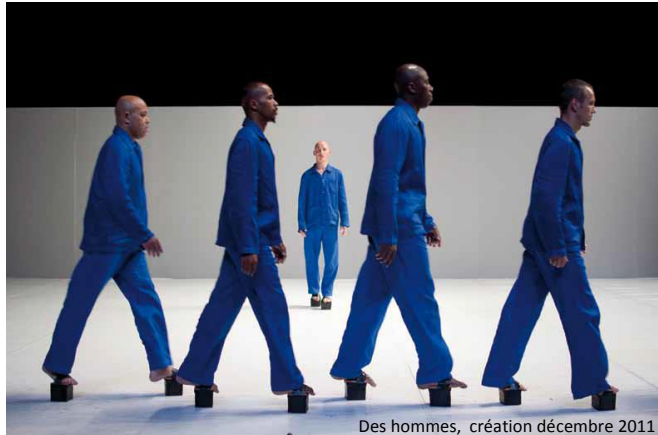
Des hommes, création décembre 2011

Ce spectacle est l'occasion d'une nouvelle collaboration artistique avec Bernardo Montet. Le chorégraphe et Madeleine Louarn ont déjà collaboré à plusieurs reprises autour d'un même intérêt pour les comédiens de l'atelier Catalyse. En 2002, ils réalisent la performance J'Deb avec deux comédiens de Catalyse sur un texte de Joris Lacoste dans le cadre du festival Antipodes au